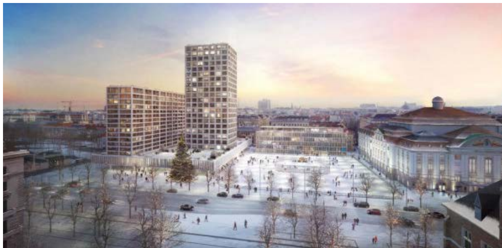
Das Hochhaus-Projekt am Heumarkt gefährdet den Welterbe-Status des historischen Wiener Zentrums.

Die am Freitag gegründete Initiative „Rettet das UNESCO-Welterbe ‚Historisches Zentrum von Wien‘!“ will nun gegen das Hochhausprojekt am Wiener Heumarkt vorgehen.