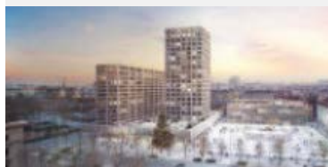
Projekt Heumarkt neu

Die UNESCO verleiht den Titel Welterbe (Weltkulturerbe und Weltnaturerbe) an Stätten, die aufgrund ihrer Einzigartigkeit, Authentizität und Integrität weltbedeutend sind und von den Staaten, in denen sie liegen, für den Titel vorgeschlagen werden. Der Titel beruht auf der mit Stand 2016 von 193 Staaten und Gebieten ratifizierten bzw. angenommenen Welterbekonvention von 1972.